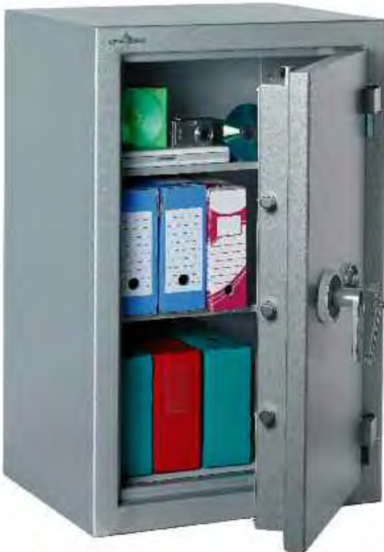
Zephir Duo 1149.

Ignífuga papel 30 minutos • Normativa Europea EN 15659 / S30P