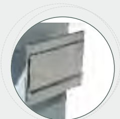
➤ Buzón depósito