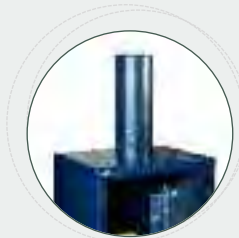
➤ Deposito neumático