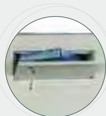
➤ Tolva de depósito