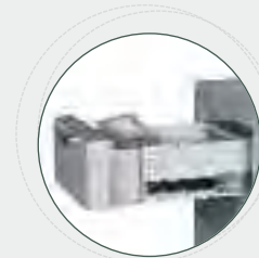
➤ Cajón de depósito certificado grado 1