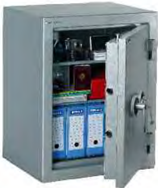
Zephir Duo 1114.