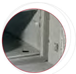
↘ Juntas múltiples para asegurar la estanqueidad en caso de incendio