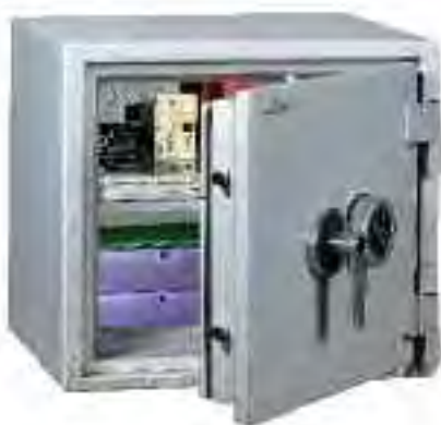
Protect Fire 50. Equipamiento Estándar con una Bandeja regulable en intervalos de 40mm.