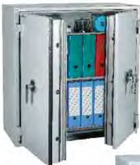
Protect Fire 246. Equipamiento Estándar con 2 Bandejas regulables en intervalos de 40mm.