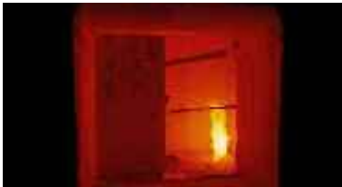
Test efectuados en situaciones reales.