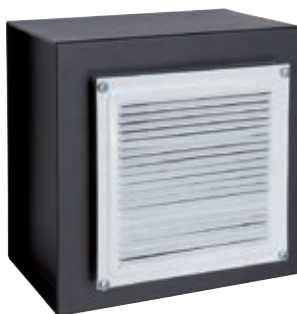
GRID Ref. 13000W-S0