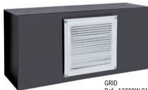
GRID Ref. 13000W-S1