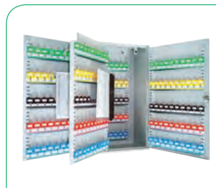
Armario 300 llaves.