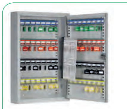
Armario 60 llaves.