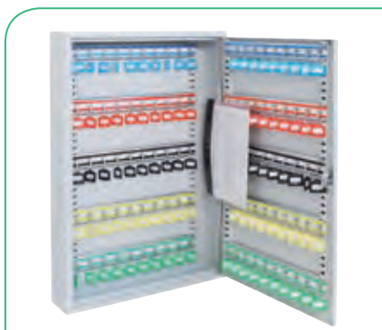
Armario 100 llaves.