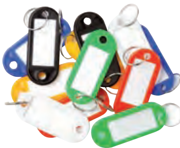
Porta etiquetas para llaves A-1642052