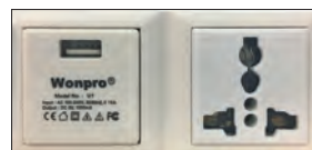
USB INTERNO Y ENCHUFE