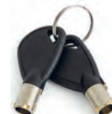
LLAVES DE EMERGENCIA

(*). Solo disponible en Pedidos de fabrica.