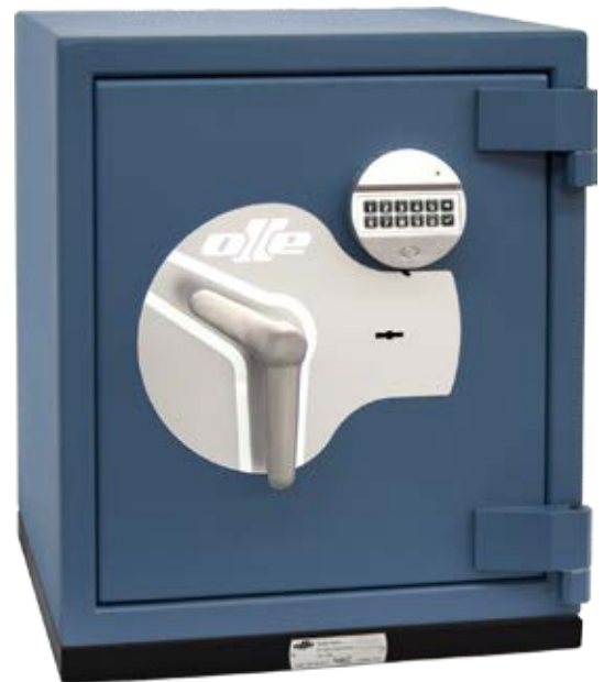
AP2 + KPASTR2