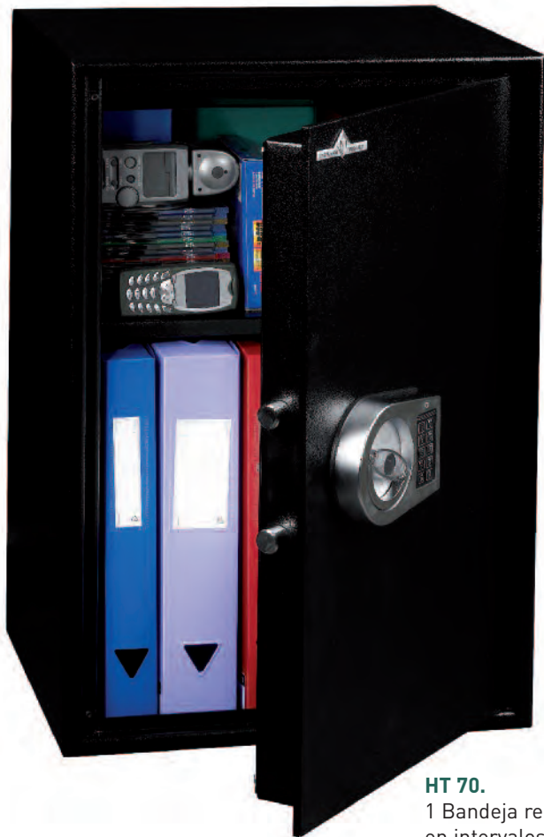
HT 70. 1 Bandeja regulable en altura en intervalos de 40mm.

Protección contra robo normativa europea EN 14450. Grado S1 (Solo los modelos con cerradura a llave). Blindaje anti taladro de acero al manganeso.