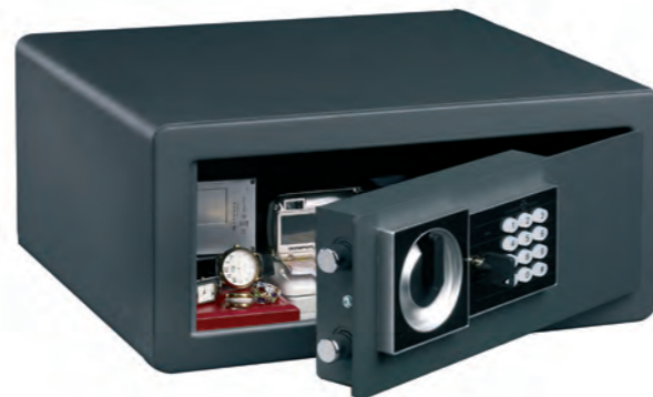
HES 25 Ideal para tablets y ordenadores portatiles de hasta 15" pulgadas