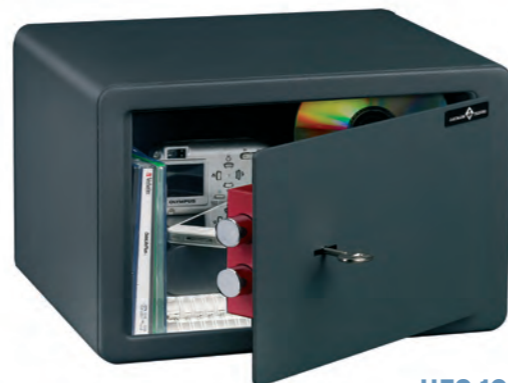
HES 10 Disponibile con cerradura de llave unicamente