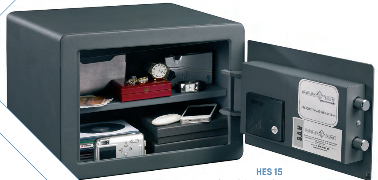
HES 15 Con una bandeja interior regulable en altura incluida