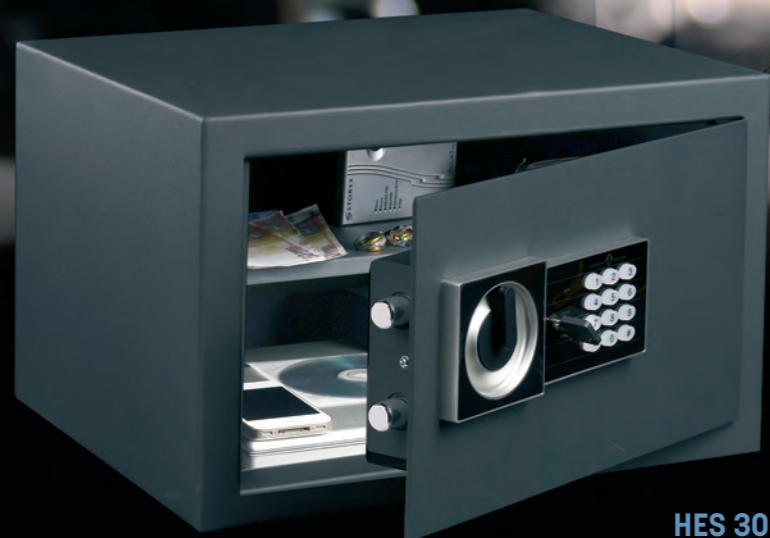
HES 30 Con una bandeja interior regulable en altura incluida