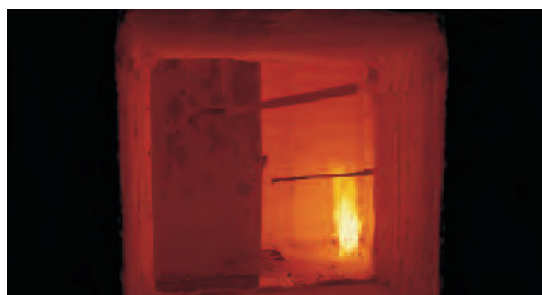
Test efectuados en situaciones reales.