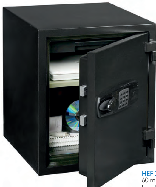
HEF 30 60 minutos ignífuga bandeja extensible y estantería ajustable.