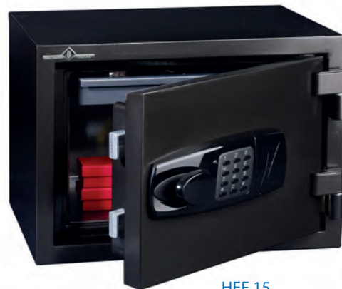
HEF 15 60 minutos ignífuga Bandeja extensible ajustable.