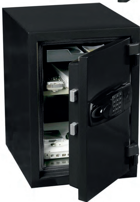
HEF 40 90 minutos ignífuga bandeja extensible y estantería ajustable.