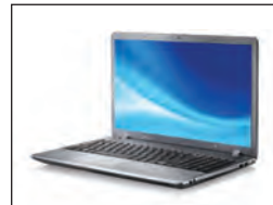
Ideal para ordenadores portátiles. HS458-02 hasta 15 pulgadas, HS470-02 hasta 17 pulgadas