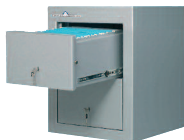
Modelo de 2 cajones adaptable a escritorios