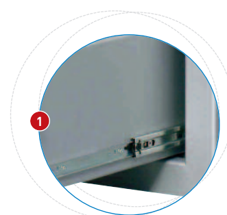
Guías sobre rodamientos inoxidables.