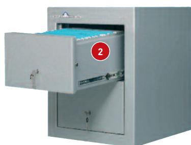
Modelo de 2 cajones adaptable a escritorios.