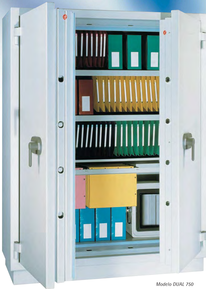
Modelo DUAL 750