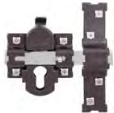
C/C (con cilindro) S/C (sin cilindro)

Acabado níquelado y pintado dorado, blanco y marrón Barra de acero de 18 x 15 mm Placa de acero de 2 mm Cerradero en acero de 3 mm Cilindro de perfil europeo de 55 x 10 mm de longitud