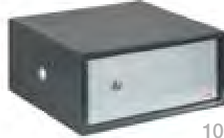
100 LL PC