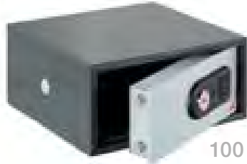
100 E PC