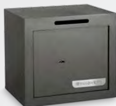
Cerradura de gorjas con llave de doble paletón