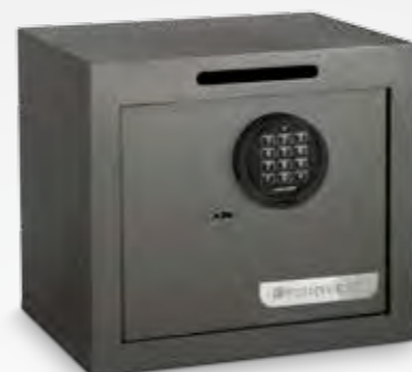
Cerradura de gorjas + cerradura electrónica con retardo programable