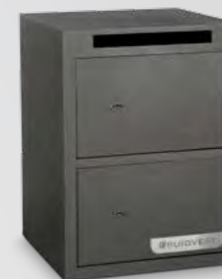
Cerradura de gorjas con llave de doble paletón