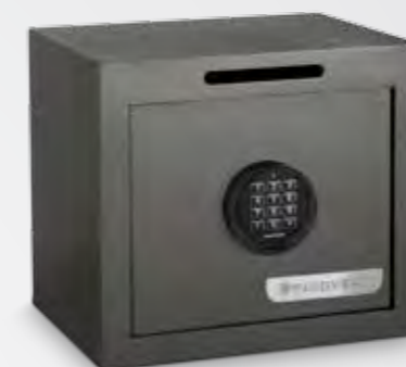
Cerradura electrónica con retardo programable