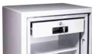
Modelo 75-E incluye cajón interior con llave, situado en la parte superior.