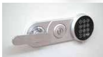
Modelo 75-E incluye cerradura de puntos, teclado digital y maneta.