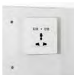
Enchufe interior con USB

La seguridad del huésped está garantizada con esta caja fuerte, muy fácil de gestionar y con un moderno diseño.