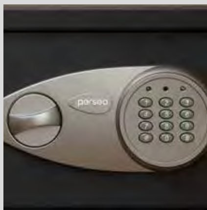
Teclado + pomo giratorio