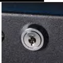
Alquiler con llave interior