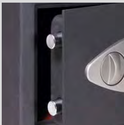
2 bulones Ø18 mm

La seguridad del huésped está garantizada con esta caja fuerte, muy fácil de gestionar y con un moderno diseño.