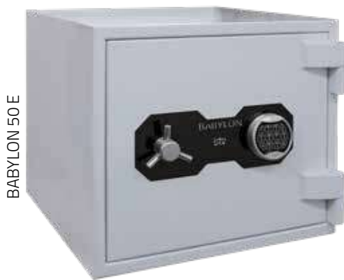
BABYLON 50 E