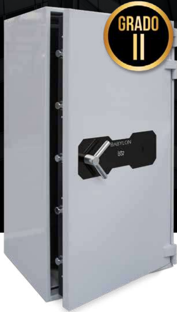
BABYLON 150 K

Serie de cajas fuertes de alta seguridad certificadas por ECBS con el Grado II de resistencia al robo de acuerdo a la norma UNE EN 1143-1:2012.