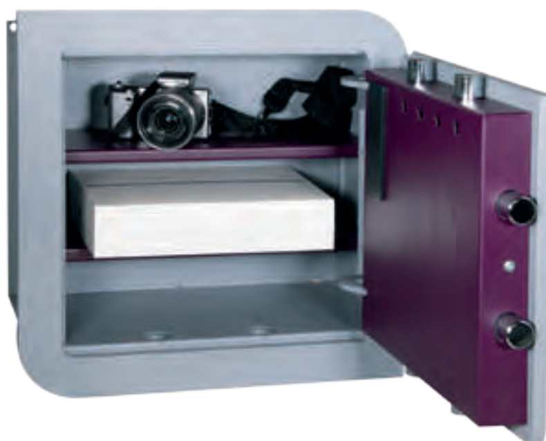
CZ WE 40-20

Iluminación interior mediante LEDs de bajo consumo