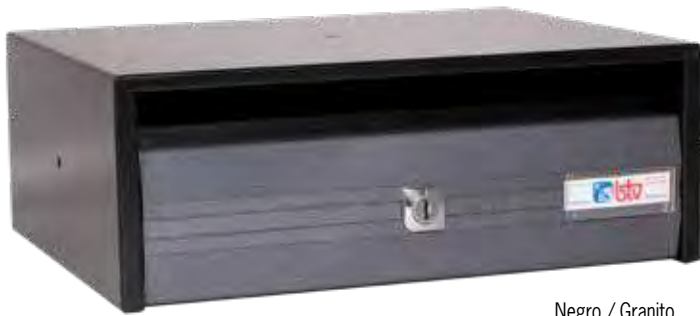
Negro / Granito