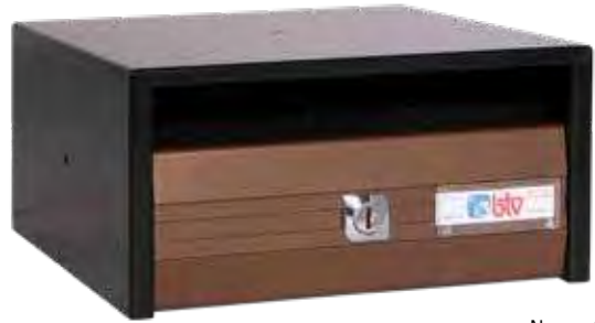
Negro / Bronce