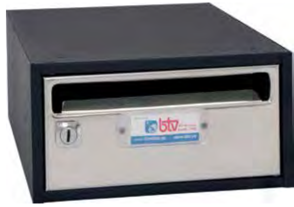
Negro / Plata