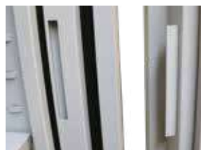
Estructura del marco reforzada con alojamiento para placa longitudinal en modelos 1993, E-1993 y E-19130.