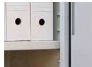
Estantes regulables en altura.