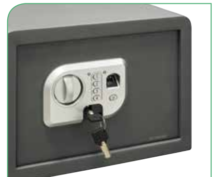
Dispone de llave de emergencia