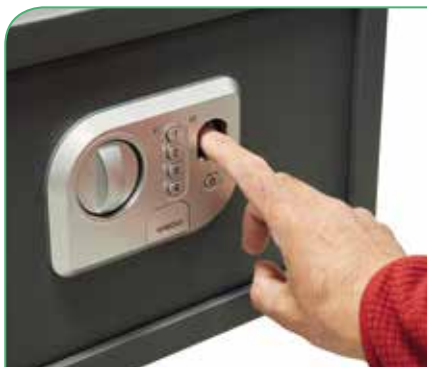
Con lector de huella dactilar