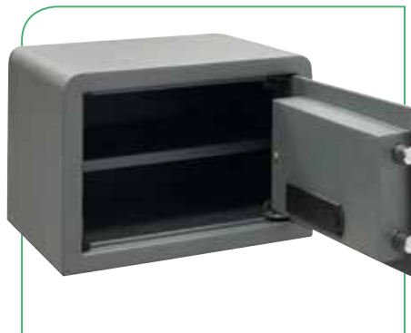
Dispone de bandeja interior