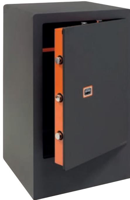
PLUS C CON ZÓCALO Ref. 180390