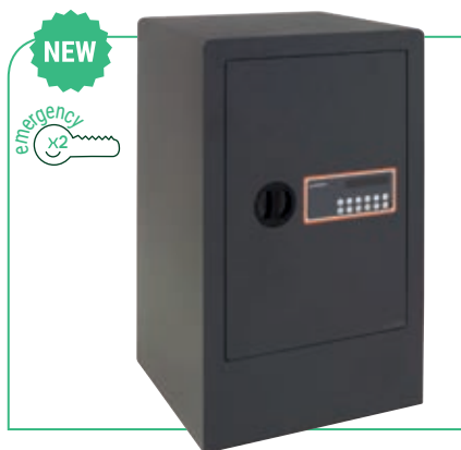
Ref. 180190: no dispone de homologación S2.