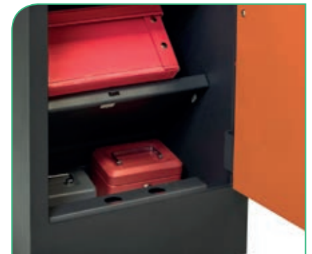
Dispone de cajón interior en el zócalo, para un máximo aprovechamiento del espacio.