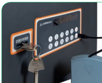
Toma de corriente externa tipo micro USB.