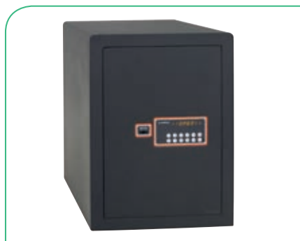
PLUS C Ref.180080

* Los mod. 180110 y 180120 no disponen de homologación S2.