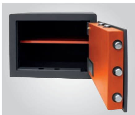
Con alojamiento para bulones.