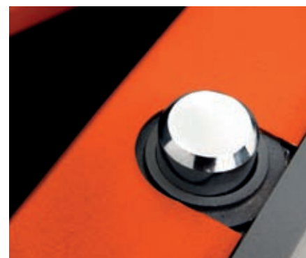
Bulones giratorios y guiados, que impiden su corte desde el exterior