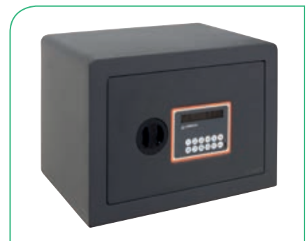
PLUS C Ref.180120. Electrónica con pomo.