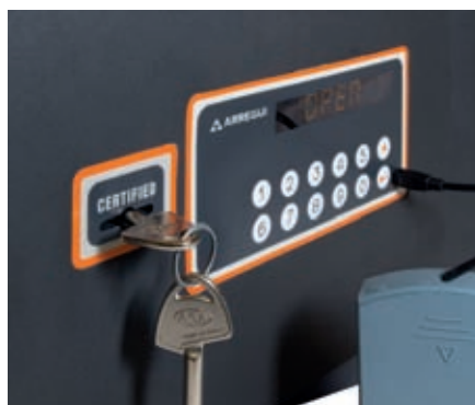
Toma de corriente externa tipo micro USB.