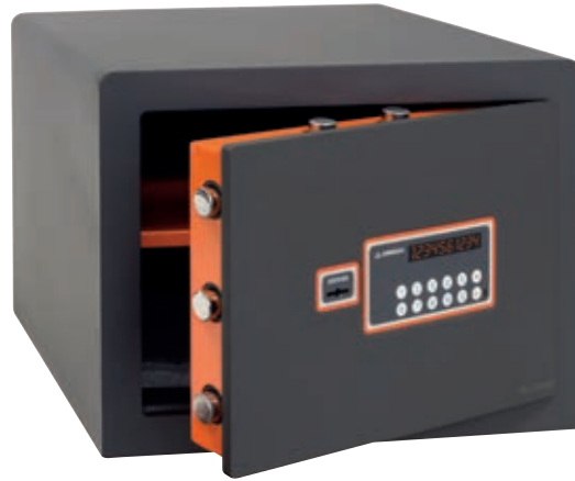
PLUS C Ref. 180050