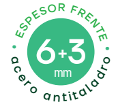
FORMA EVOLUTION CON RANURA Ref. 150040-SL