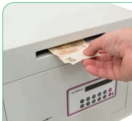
Ranura de 162x15 mm para introducir documentos o billetes sin necesidad de abrir la caja.