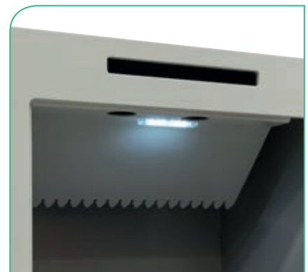
Rampa "antipesca" que evita que se extraiga el contenido desde el exterior.