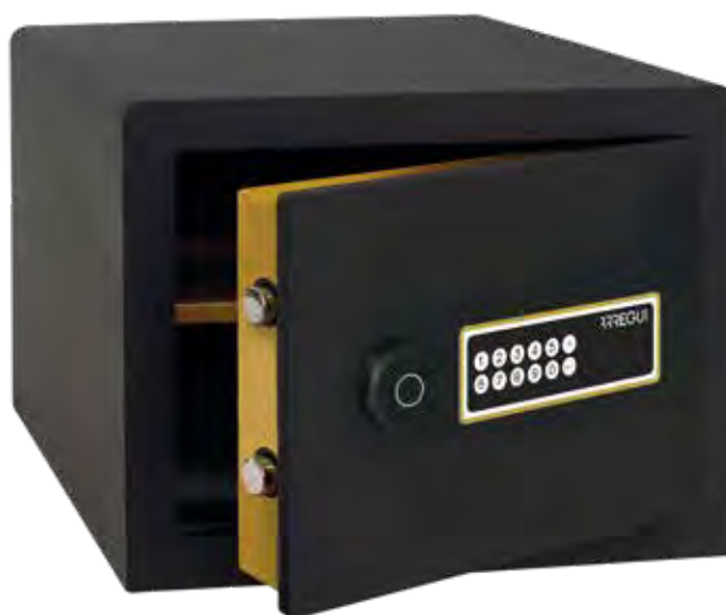
AWA Ref. 220750