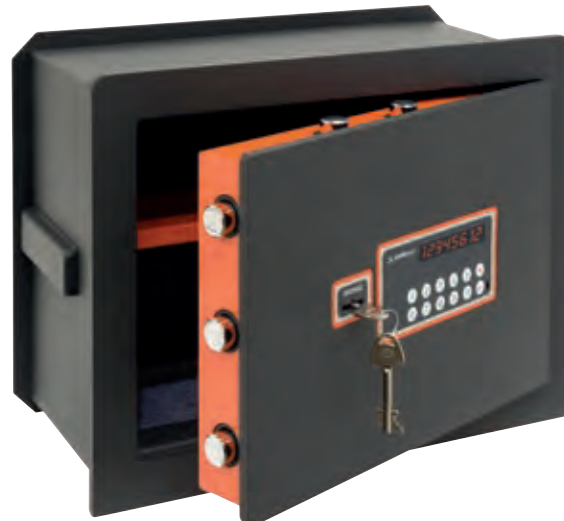
PLUS C Ref. 181050