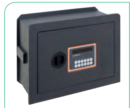
PLUS C ELECTRONICA ref. 181120