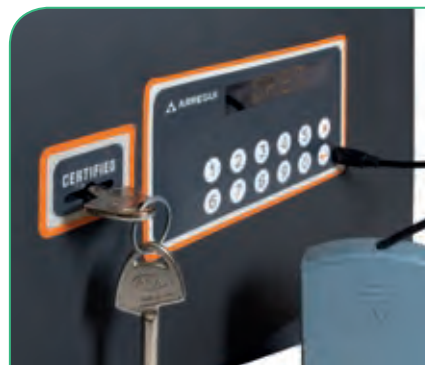
Toma de corriente externa tipo micro USB.