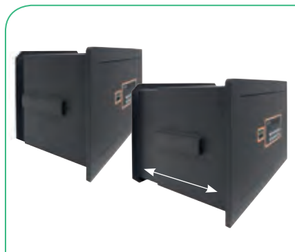
Fondo regulable, 5 posiciones cada 25 mm

* Los mod. 180110 y 180120 no disponen de homologación S2.