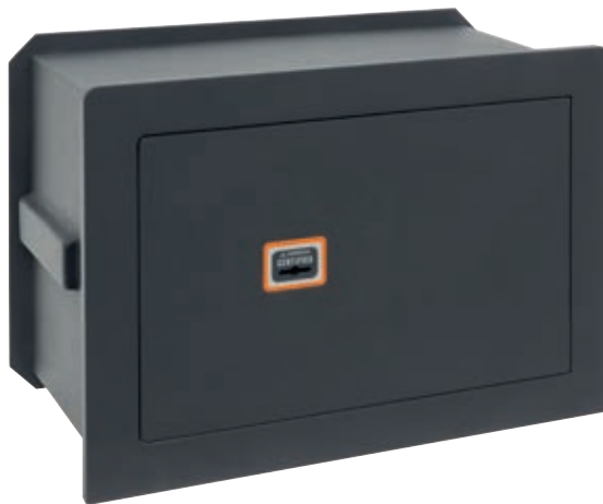
PLUS C Ref. 181340

! Al tratarse de una CERRADURA CERTIFICADA , el duplicado de llaves solo puede realizarlo un Servicio de Asistencia Técnica autorizado por Arregui, siendo necesario acreditar la propiedad de la caja fuerte y presentar una llave original.