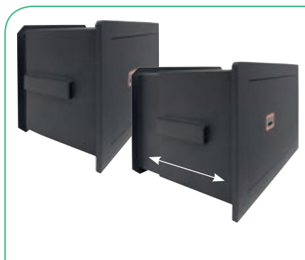
Fondo regulable, 5 posiciones cada 25 mm