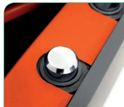
Bulones giratorios y guiados, que impiden su corte desde el exterior